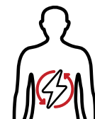
Bệnh gan nhiễm mỡ liên quan rối loạn chuyển hóa

Nó cũng có thể làm giảm nguy cơ bệnh tim, đột quỵ và bệnh thận.