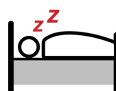
Ngưng thở khi ngủ do tắc nghẽn