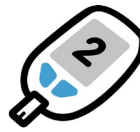
Đái tháo đường tuýp 2