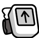
Huyết áp cao